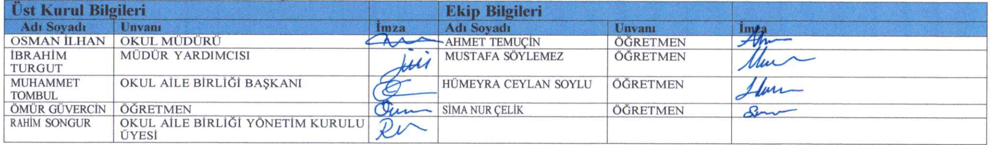
Tablo 2. Strateji Geliştirme Kurulu ve Stratejik Plan Ekibi

Stratejik Plan Ekibi: Okul müdürü tarafından görevlendirilen ve üst kurul üyesi olmayan müdür yardımcısı başkanlığında, belirlenen öğretmenler ve gönüllü velilerden oluşur.